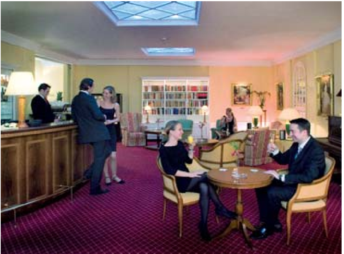
Bar bei Tag und Nacht